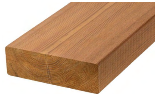
Thermory Pino Thermo-D SHP 26x88mm / $24.482 m