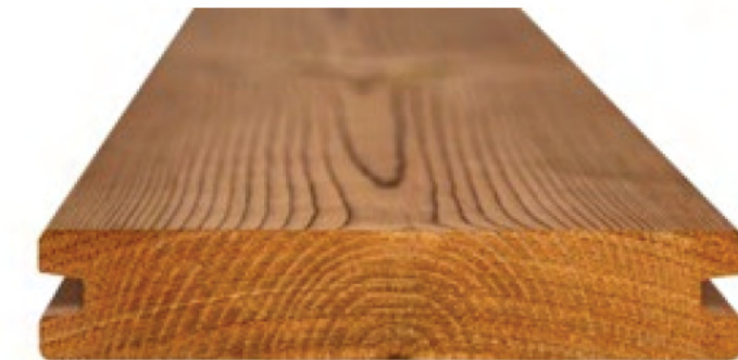
Thermory Pino Thermo-D SHP 26x118mm con Clips / $309.000 m2