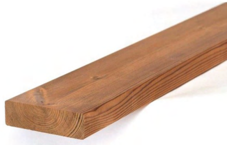
Thermory Ábeto Thermo-D SHP 19x92mm/ Modificable / $19.500