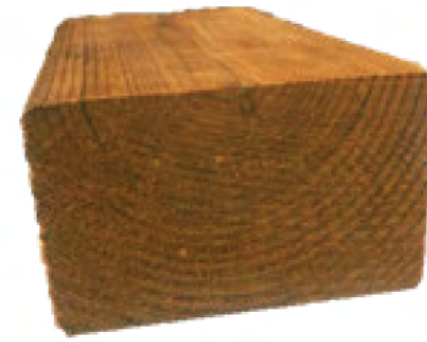
Thermory SHP 42x68mm / Modificable / $31.500 m