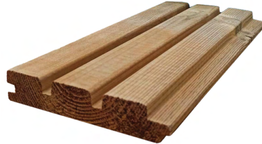
Thermory Pino Triple Shadow 26x140mm / $315.000 m2