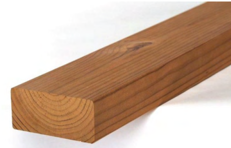
Thermory SHP 42x92mm / Modificable / $37.500 m