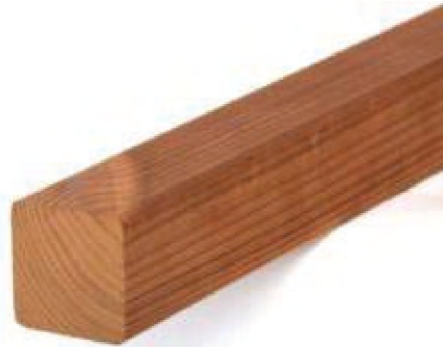
Thermory SHP 42x42mm /Modificable / $20.500 m