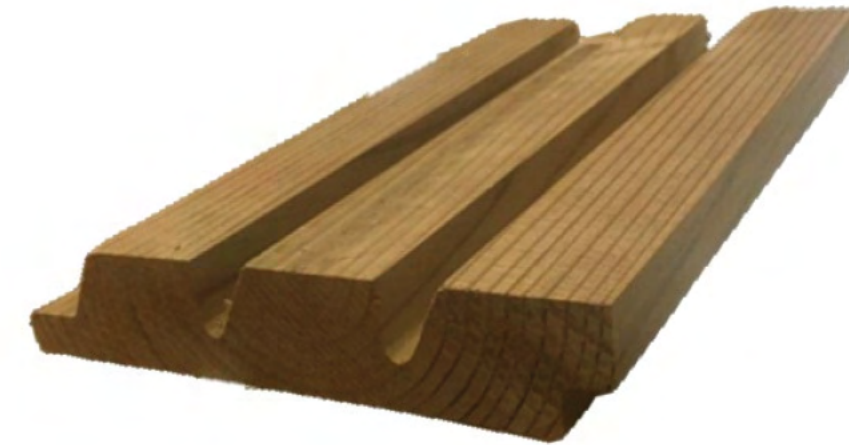
Thermory Pino Triple Shadow Inclinado 26x140mm *ideal para instalación horizontal