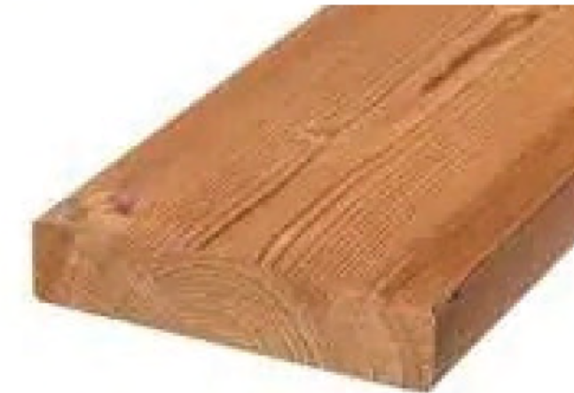
Thermory Pino Thermo-D SHP 26x117mm / $32.319 m