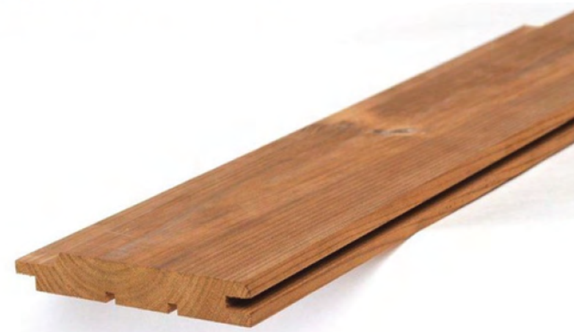
Thermory Ábeto Thermo-D UTS /UTV 19x117mm / $230.000 m2