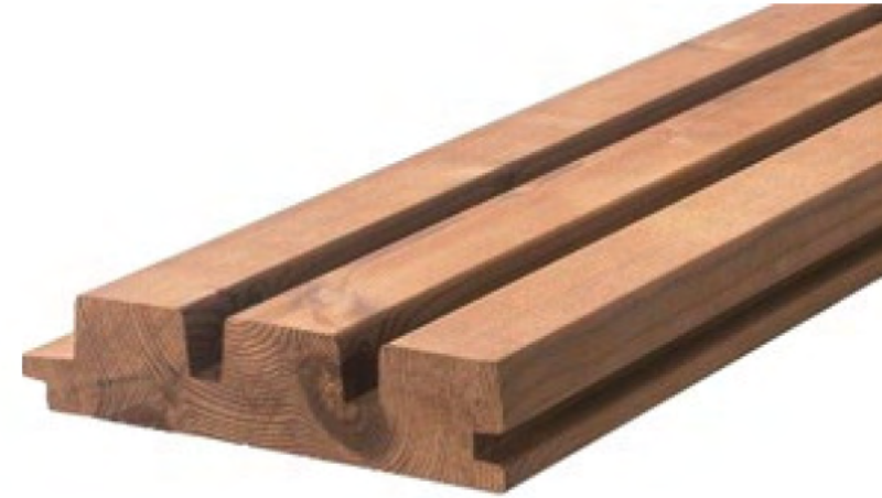
Thermory Pino Triple Shadow 32x140mm / $349.000 m2